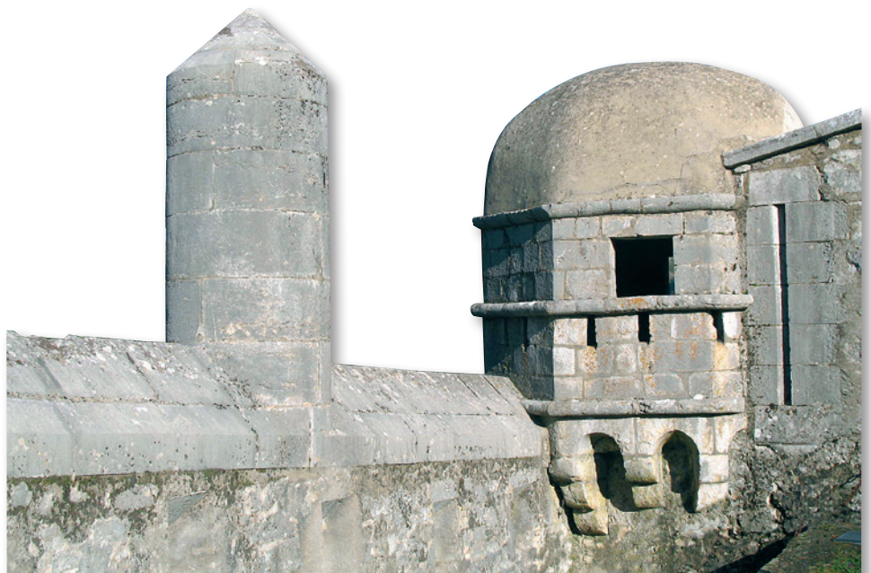
Face Nord : Echaugette et sa «Dame» (XIX e s.)