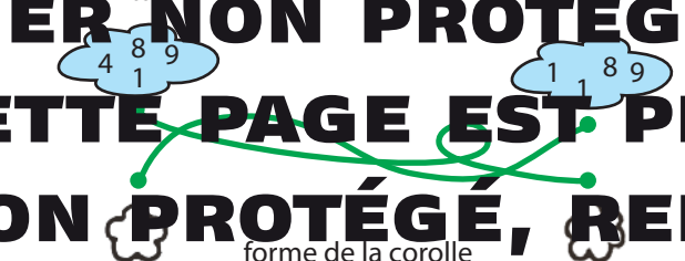
forme de la corolle

6 Quel animal reconnais-tu en passant du Christ en croix?