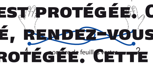
nombre de feuilles vertes

Sur la borne, il y a deux chiffres gravés sur la face principale. Retrouve-les.