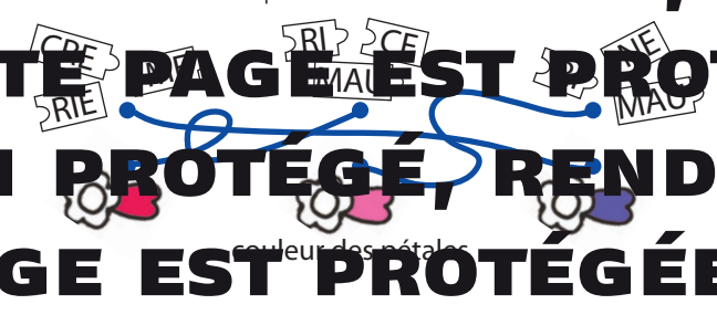
couleur des pétales