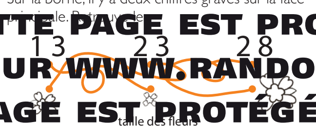
taille des fleurs