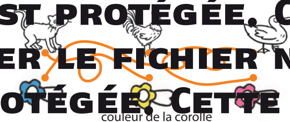
couleur de la corolle

2 Quel groupe d'étiquettes te permet de reconnaître le principal des animaux choisis?