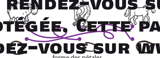
forme des pétales

CETTE PAGE EST PROTÉGÉE. CETTE PAGE EST PROTÉGÉE.