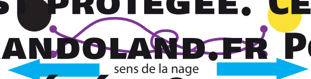
sens de la nage