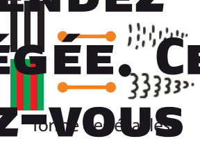
forme de la queue