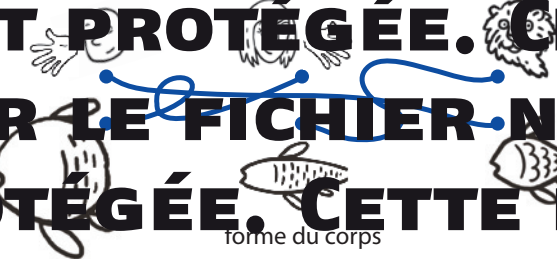
forme du corps

2 Façade du Louvre Contemple la façade du musée du Louvre. Juste en dessous du triangle, il y a dix figures de femmes (deux de chaque côté). Que tient dans sa main droite la femme la plus à gauche ?